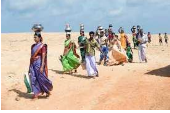
மரபுக் கதை 5