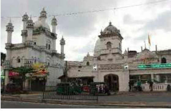
மரபுக் கதை 8