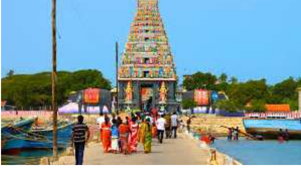
மரபுக் கதை 17