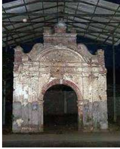
மரபுக் கதை 6