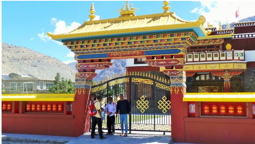
லாப்ராவில் உள்ள போன்பா புத்த விகாரம்