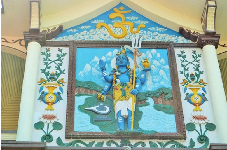
பசுபதி நாதர் ஆலயம்

பின்னர் பேருந்து மூலம் காத்மாண்டு நகரை அடைந்து பசுபதிநாதர் ஆலயம், குஹ்யேஸ்வரி அம்மன் ஆலயம் மற்றும் புத்த நீலகண்டர் ஆலயம் (ஜல நாராயணர் ஆலயம்) சென்று தரிசனம் செய்தனர்.