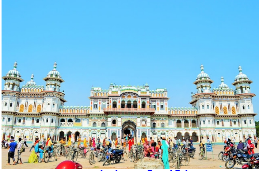
ஜனக்பூர் ஜானகி மந்திர்

ஆலயத்தில் சிறப்பாக கொண்டாடப்படுகின்றது, மேலும் இராமநவமியும் மிக சிறப்பாக கொண்டாடப்படுகின்றது. ஹோலி, சாத் பண்டிகை, தீபாவளியும் மிகவும் விசேஷம்.