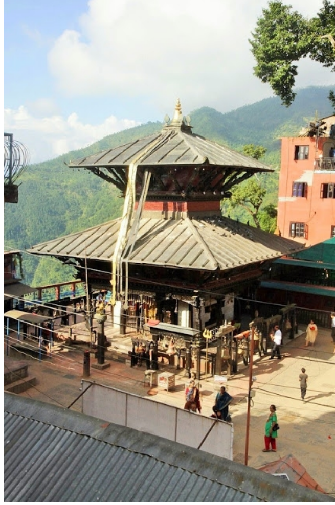
மனோகாம்னா தேவி ஆலயம்

அடியேனுக்கு முக்திநாத் யாத்திரை ஒரு வருடம் திருக்கயிலாய யாத்திரை சென்ற சமயம் சித்தித்தது. எனவே திருக்கயிலை நாதரின் அருமையான தரிசனமும் கிரி வலமும் நிறைவு செய்த பின் காத்மாண்டு வந்து தங்கினோம். பசுபதிநாதர் ஆலயம் சென்று சிவபெருமானுக்கு நன்றி தெரிவித்தோம். சென்னையில் இருந்து முக்திநாத் யாத்திரைக்கு ஒரு குழுவினர் காத்மாண்டு வந்திருந்தனர். ஆக மொத்தம் இரு பேருந்துகளில் முக்தி நல்கும் நாதரை தரிசிக்க கிளம்பினோம்.