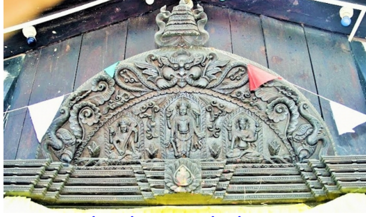
முன் மண்டப முகப்புப் பதாகை