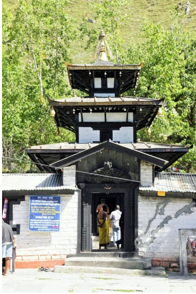
முத்திநாதர் ஆலயம் (பின் அட்டைப்படம்)