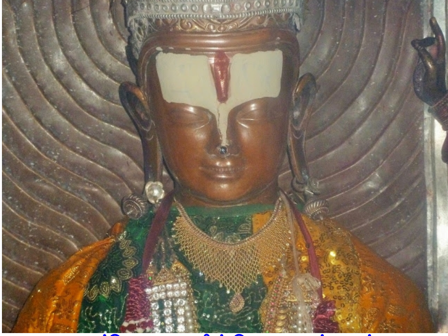
முக்தி நாராயணரின் திருமுக மண்டலம்

முன் மண்டபத்தின் கதவில் அருமையான சிற்பங்கள் மற்றும் அருமையான மரவேலைப்பாடுகள் அமைந்துள்ளன. ஒரே பிரகாரம் சுற்றி வந்து முக்தி நாதரின் எதிரே நின்றோம்.