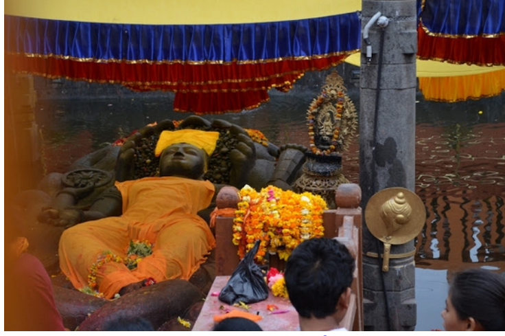
ஜல நாராயணர் ( புத்த நீலகண்டர்)

முக்தி நாதரை தரிசனம் செய்த பின்னர், இவர்கள் குழுவில் இருந்து ஒரு சிலர் காத்மாண்டுவிலிருந்து விமானம் மூலமாக டெல்லி வந்து பின்னர் சென்னை வந்தடைந்தனர். இன்னொரு குழுவினர் காத்மாண்டுவிலிருந்து பேருந்து மூலமாக மஹேந்திர நெடுஞ்சாலை வழியாக ஜனக்பூருக்கு புறப்பட்டு சென்றனர். ஜனக்பூர் நேபாளத்தில், காத்மாண்டிலிருந்து 135 கி.மீ தூரத்தில் அமைந்துள்ளது. பேருந்தில் சுமார் 7 மணி நேரம் பயணம். இப்பகுதி சமவெளி என்பதால் பசுமையான வயல்களைக் காணலாம். காத்மாண்டுவிலிருந்து சிறு விமானம் மூலமும் ஜனக்பூரை அடைய முடியும். ஜனக்பூரில் இருந்து சிறு புகைவண்டி பாதை (Nattow Gauge) இந்திய எல்லையான ஜெயநகர் வரை உள்ளது.