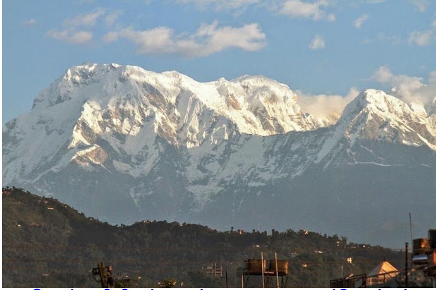
போக்ராவிலிருந்து அன்னபூரணா மலைச்சிகரங்கள்

அன்னபூரணா மலையேற்றம் செல்பவர்களும் மற்றும் முக்திநாத் யாத்திரை செல்பவர்களும் போக்ராவில் தங்கி செல்கின்றனர். ஆனால் புனல் மின்சாரம் அபரிமிதமாக தயாரிக்கக்கூடிய தேசமாக இருந்தும் கூட காத்மாண்டுவிலும் சரி இங்கு போக்ராவிலும் மின்சாரம் எப்போதும் இருப்பதில்லை. எப்போது வரும் என்று யாருக்கும் தெரியவில்லை இரவு மட்டும் தங்கும் விடுதிகளில் மின்ஜெனரேட்டரை இயக்குகின்றனர். போக்ரா 800 மீ உயரத்தில்தான் அமைந்துள்ளதால் வெகு நாட்களுக்குப் பிறகு கம்பளி ஆடைகளை கழற்றினோம், மின் விசிறி தேவைப்பட்டது.