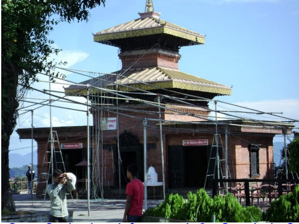
இராதா கிருஷ்ணர் - லக்ஷ்மி நாராயணர் - சீதா இராமர் சன்னதி

ஸ்ரீசக்ரம் அமைத்துள்ளனர். அம்மனை தொட்டு வணங்க அனுமதிக்கின்றனர். மேலும் கணபதி, பசுபதிநாதர், லக்ஷ்மி நாராயணர், இராதா கிருஷ்ணர், சீதா இராமன் சந்நிதிகளும் இவ்வளாகத்தில் அமைந்துள்ளன. ஒரு ருத்ராட்ச மரமும் ஆலய வளாகத்தில் உள்ளது. அருமையான மர வேலைப்பாடுகள் கொண்ட கதவுகள், ஜன்னல்கள் இவ்வாலயத்தின் ஒரு தனி சிறப்பு ஆகும். குன்றின் மேலிருந்து போக்ரா நகரத்தின் அழகைக் கண்டு இரசிக்கலாம்.