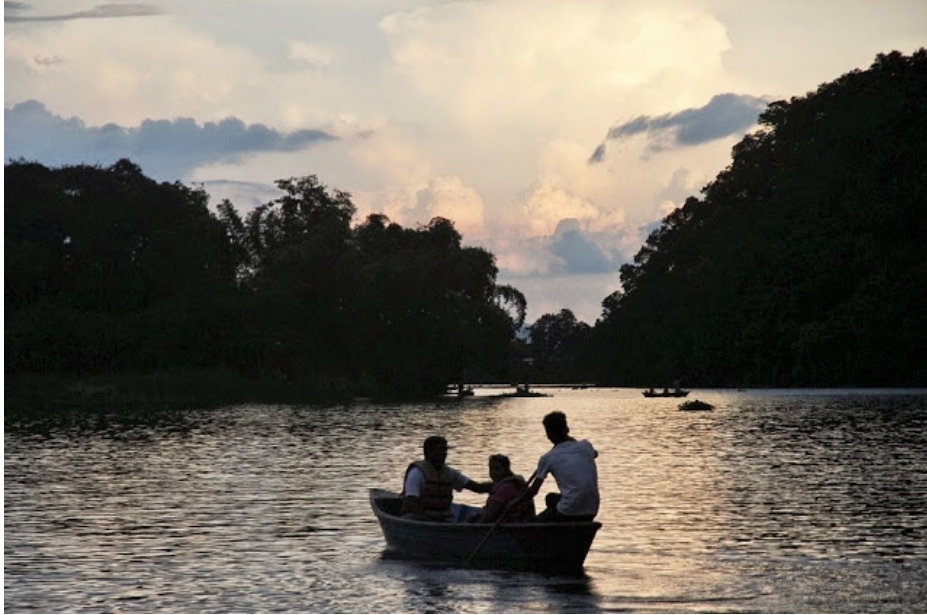
பொன் மாலைப் பொழுதில் ஃபேவா ஏரியின் அழகு

ஏரியின் நடுவில் லேக் வராஹி ஆலயம் அமைந்துள்ளது. ஐரோப்பியர்கள் அதிகம் வருவதால், கண்காணிப்பு கோபுரம், அதி வேக மீட்புப் படகுகள், படகில் பயணம் செய்யும் அனைவரும் பாதுகாப்பு கவசம் அணிய வேண்டும் எல்லா வகையான பாதுகாப்பு அம்சங்களும் உள்ளன. நேரம் குறைவாக இருந்ததால் அடியோங்கள் லேக் வராஹி ஆலயம் படகில் சுற்றி வந்து வணங்கி விட்டு தங்கும் விடுதிக்கு திரும்பி வந்தோம். வரும் வழியில் மழை பெய்ய ஆரம்பித்து விட்டது, சூரியன் மறையும் அழகையும் இரசித்தோம். இவ்வாறாக அரை நாளில் அவசரம் அவசரமாக போக்ராவின் சுற்றுலாவை நிறைவு செய்தோம்.