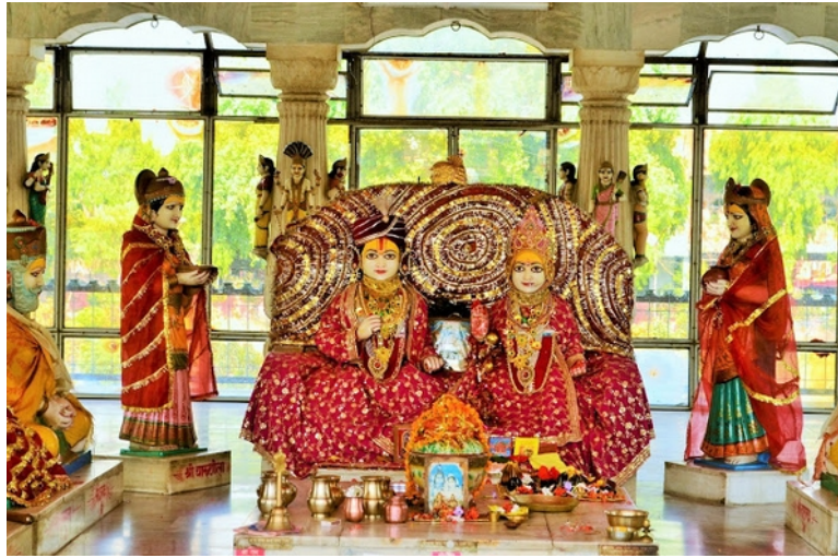
சீதா இராமர் திருக்கல்யாணக் கோலம்

ஜனக்பூர் ஜனக மஹாராஜாவின் தலை நகரம், சீதா இராமர் திருக்கல்யாணம் நடந்த இடம். மேலே உள்ளது கல்யாண மண்டபம். சீதா மார்ஹி ஜனகருக்கு சீதா தேவி கிடைத்த இடம். அதாவது சீதா தேவியின் பிறந்த இடம். இது பீகார் மாநிலத்தில் தற்போது அமைந்துள்ளது.