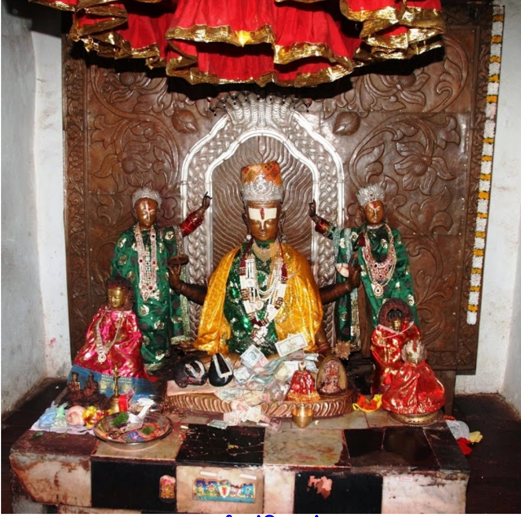
ஸ்ரீமுத்திநாதர் (முன் அட்டைப்படம்)