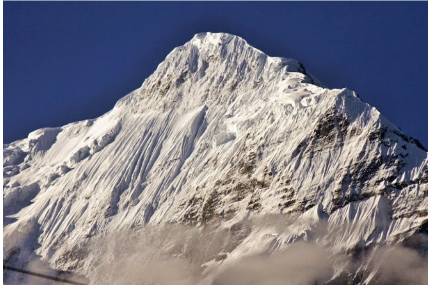
ஜோம்சமில் உள்ள நீலகிரி பனிச் சிகரம்

இந்நகரத்தின் காவல் தெய்வம் பிந்து வாசினி ஆலயம் ஒரு சிறு குன்றின்மேல் அமைந்துள்ளது. சிறு ஆலயம் தான். சாளக்கிராம ரூபத்தில் பகவதியாக எழுந்தருளி அருள் பாலிக்கின்றாள் அன்னை பார்வதி இத்தலத்தில். மற்ற நேபாள அன்னை ஆலயங்களைப் போல இங்கும் பலியிடப்படுகின்றது. பகோடா அமைப்பில் இக்கோவில் அமைந்துள்ளது. குன்றின் மேலிருந்து போக்ரா நகரின் அருமையான அழகை இரசிக்கலாம்.