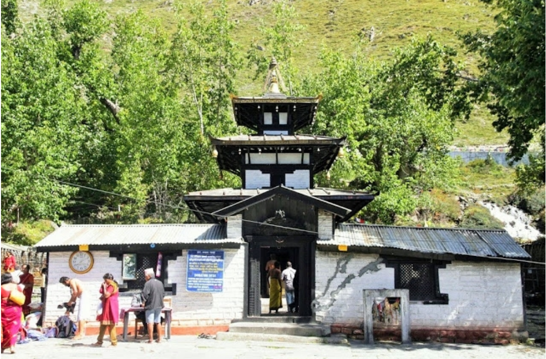
ஒரு முன் மண்டபம் ஒரு பிரகாரத்துடன் மூன்றடுக்கு பகோடா அமைப்பு

இந்த ஆலயத்தை நேபாள அரசர் ஷா ராணா பகதூரின் பட்டமகிஷி சுவர்ணா பிரபா தனது கனவில் வந்து முக்திநாதர் கட்டளையிட்டபடி 1815 ல் கட்டி முடித்தார். நேபாளக் கோவில்களைப் போலவே மூன்றடுக்கு பகோடா அமைப்பில் எழிலாக அமைந்துள்ளது முக்திநாதர் ஆலயம். ஆலயத்திற்கு முன் புறம் இரண்டு குளங்கள் புண்ணிய-பாவ குளங்கள் உள்ளன.