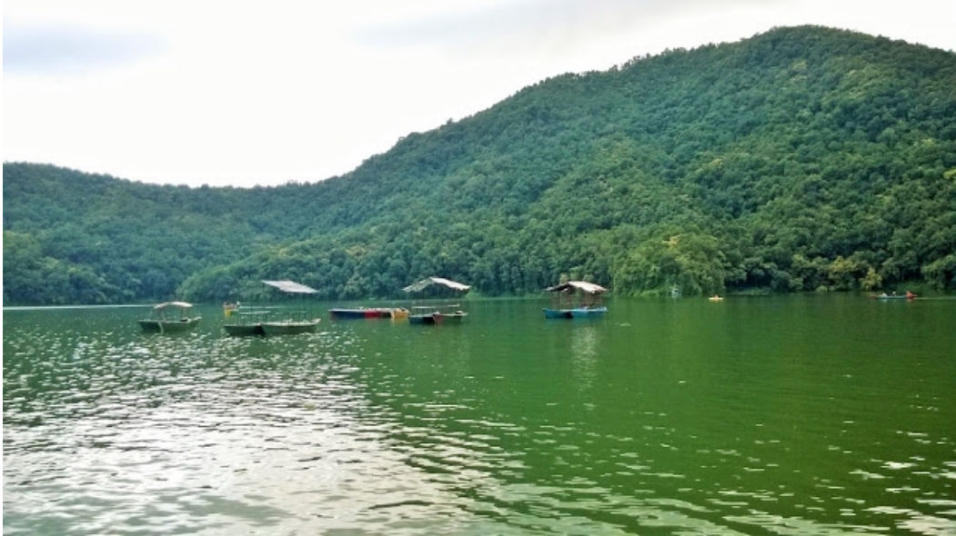
பேவா ஏரியில் படகுகள்

போக்ராவின் சிறப்பே அதன் ஏரிதான். இந்த ஏரியில் படகுப்பயணம் செய்யாவிட்டால் போக்ரா சென்றதே வீண் என்று சொல்லலாம். ஃபேவா ஏரி” (Phewa Lake) என்று அழைக்கப்படும் இந்த அழகான ஏரி நேபாள் நாட்டின் இரண்டாவது பெரிய ஏரி ஆகும். சுற்றிலும் நெடிதுயர்ந்த பனி மூடிய மலைச்சிகரங்கள் அதன் அடிவாரத்தில் பச்சை நிரத்தில் மிகவும் விலாசனமான ஏரி. அருமையான சூழலில் அமைந்துள்ளது பேவா ஏரி.