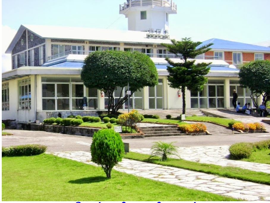
போக்ரா விமான நிலையம்

திரும்பி வரும் போது போக்ரா நகரத்தில் உள்ள பேவா ஏரியின் (Phewa Lake) அழகை பறவைப்பார்வையாக பார்த்து இரசித்தோம். மலைகளுக்கு நடுவில் மரகத வர்ணத்தில் மிகப்பெரிய ஏரியை பார்க்கும் ஆனந்தமே தனி. தங்கும் விடுதி வந்து சிறிது நேரம் ஓய்வெடுத்துக்கொண்டு மதிய உணவிற்குப்பின் போக்ரா சுற்றுலாவிிற்காக கிளம்பினோம்.