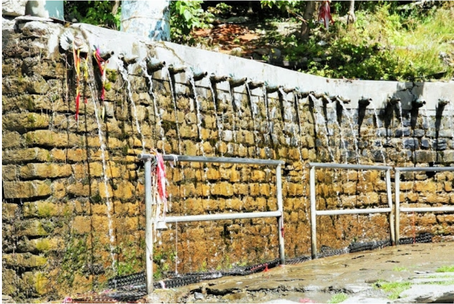
அரை வட்ட வடிவில் 108 நீர் தாரைகள்

ஆண்டாள் நாச்சியாரின் திருப்பாவை பாசுரங்களை சேவித்துக்கொண்டே ( முதல் பாசுரத்திலிலேயே மார்கழி நீராடத்தானே அழைக்கின்றாள் கோதை) அவசர அவசரமாக மற்ற தாரைகளில் தலையை நனைத்துக்கொண்டே ஓடினோம். பாவக்குளத்தில் இறங்கியவுடன் உடல் அப்படியே உறைந்து விட்டது போல உணர்ந்தோம், அவசர அவசரமாக வெளியே வந்து புண்ணிய குளத்தில் மூழ்கி நீராடினோம். இரண்டும் நீங்கப்பெற்றோம். வெளியே வந்து தலை துவட்டி புது ஆடை அணிந்தவுடன் புது ஜென்மம் பெற்றது போல புத்துணர்வு பெற்றோம். வாருங்கள் இனி முக்திநாதரை சேவிப்போம்.