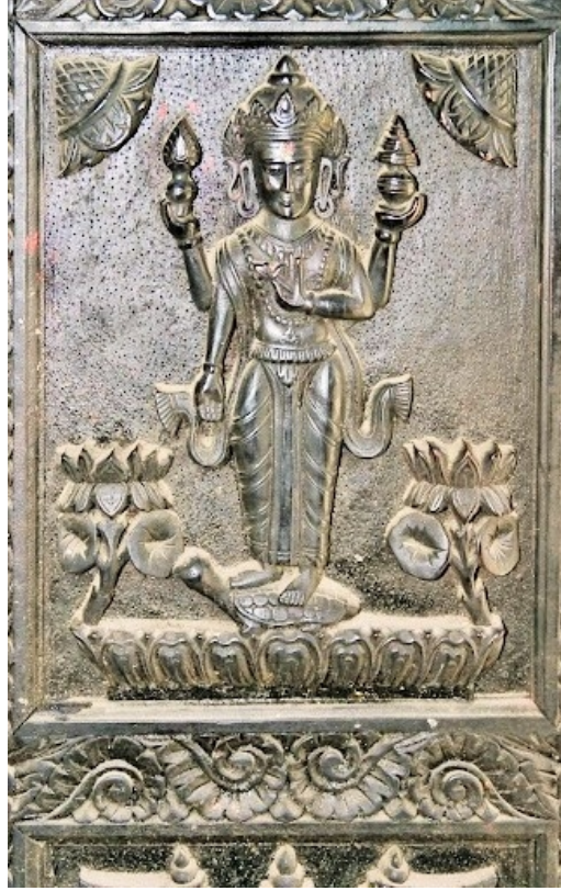
கதவின் ஒரு அழகிய சிற்பம்

ஜோம்சமில் இருந்து போக்ரா திரும்பி வரும் போது விமானம் கிடைத்ததாம்.. போக்ராவிலிருந்து பின்னர் பேருந்து மூலம் காத்மாண்டு செல்லும் மனோகாம்னாவில் அம்மனை தரிசனம் செய்தனர். இழுவை இரயில் பயணத்தையும் இரசித்தனர்.