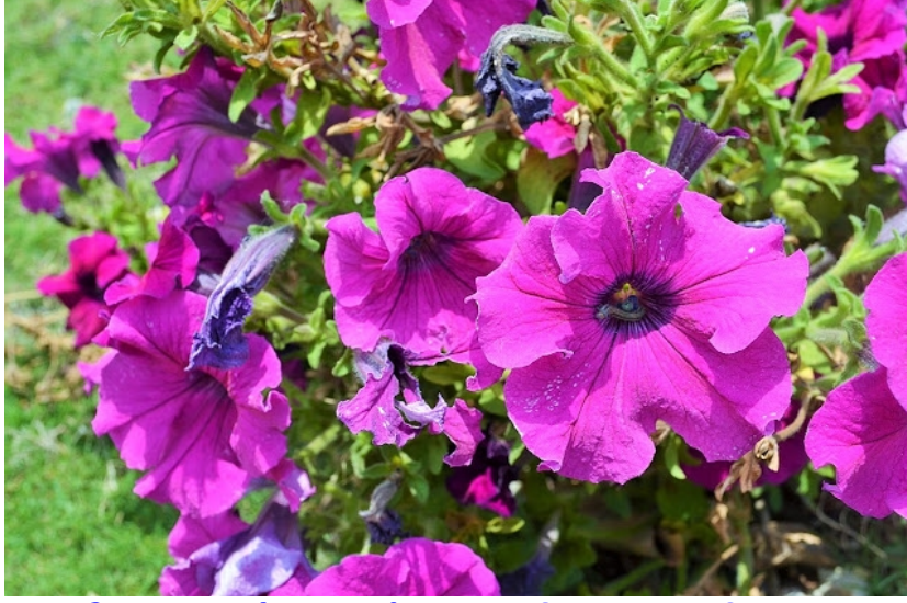
போக்ரா விமான நிலையத்தில் மலர்ந்திருந்த வண்ண வண்ண மலர்கள்

போக்ராவில் இருந்து ஜோம்சம் விமானப்பயணம் வெறும் 45 நிமிடங்கள் தான் அதுவே ஜீப்பில் அல்லது பேருந்தில் சென்றால் பாதை மலைப்பாம்பு போல வளைந்து வளைந்து செல்கின்றது என்பதாலும் தூரம் சுமார் 250 கி.மீ என்றாலும் பாதை சரியில்லை வெறும் மண்பாதை என்பதால் 12 மணி நேரத்திற்கும் மேல் ஆயிற்றாம். பயணமும் மிக கடினமாக இருந்தது என்றார்கள்.