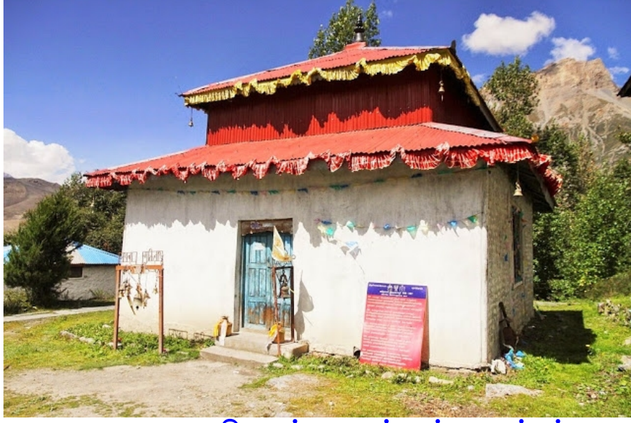
யாக சாலை - திருமங்கையாழ்வார் பாசுரங்கள்

அடுத்து யாகசாலை அமைந்துள்ளது. அதன் முகப்பில் திருமங்கையாழ்வாரின் பாசுரங்கள் எழுதிய பலகை வைத்துள்ளனர். இமயமலையில் இவ்வளவு உயரத்தில் தமிழ் படித்தபோது மிகவும் பெருமையாக இருந்தது.