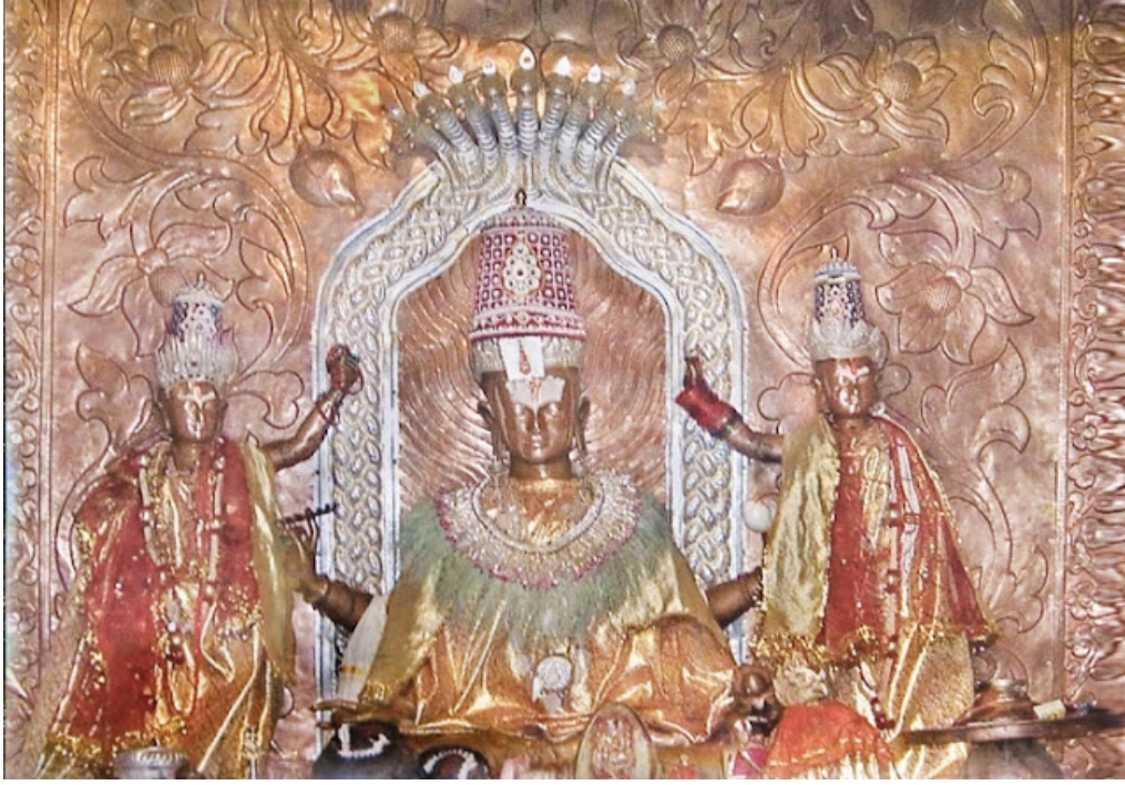
உபயநாச்சியார்களுடன் ஸ்ரீ மூர்த்தி

இவ்வளவு சிரமங்களுக்குப்பின் முக்திநாத்தை அடைந்தாலும் முக்திநாதரின் தரிசனம் திவ்யமாக இவர்களுக்கு கிட்டியது. 108 திவ்ய தேசங்களைக் குறிக்கும் 108 தாரைகளில் நீராடி, பின்னர் புண்ணிய - பாவ குளங்களில் மூழ்கி எழுந்து மிகவும் அருமையாக முக்திநாதரை தரிசனம் செய்தனர். பின்னர் ஜுவலா மாயி எனப்படும் ஜோதியையும் தரிசனம் செய்தனர்.