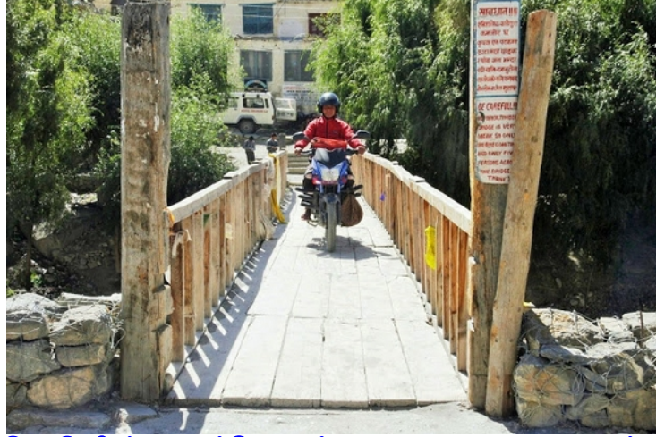
கண்டகி நதியின் குறுக்கே உள்ள பழைய பழுதடைந்த பாலம்

அறிவியலார் கூறுகின்றனர். நேபாள அரசும் சாளக்கிராமங்களை விற்பதையும், நேபாளத்தில் இருந்து வெளியே எடுத்து செல்வதையும் தடை செய்துள்ளது. ஆனால் விஞ்ஞானமும் மெய்ஞானமும் எப்போதும் ஒன்றாக இருப்பதில்லையே, கடல் வாழ் உயிரினங்களின் கூடு என்றால் இமயமலையில் இருந்து உருவாகி ஆசியா முழுவதும் பாயும் எண்ணற்ற நதிகளில் இந்த ஒரு நதியில் மட்டுமே ஏன் சாளக்கிராமங்கள் கிட்டுகின்றன என்பதை யாராலும் விளக்க முடியவில்லை. எது எப்படி இருந்தால் என்ன நம்புகின்றவர்களுக்கு சாளக்கிராமங்கள் பெருமாள்தான்.