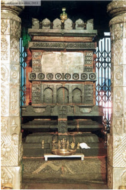
மந்திராலய மூல பிருந்தாவனம்