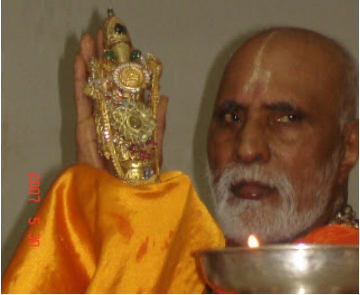
மூல இராமர் சேவை