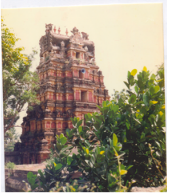
பதிப்பு ஆசிரியர் -