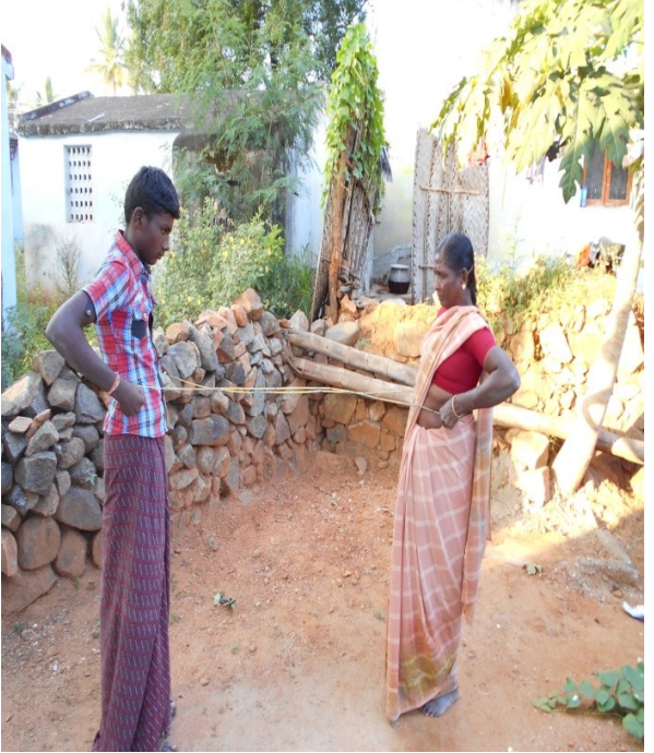
இடுப்பு வலி மருத்துவம்