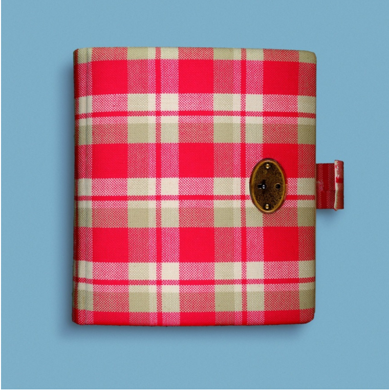
வரை டைரி எழுதி வந்தார்.