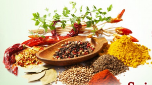
Spices மசாலா வகைகள்