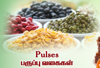
Pulses பருப்பு வகைகள்