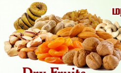
Dry Fruits உலர்ந்த பழங்கள்