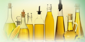
Oils மரசெக்கு எண்ணெய் வகைகள்