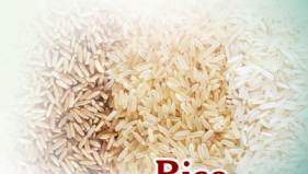
Rice அரிசி வகைகள்