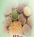
Millets திணை, சாமை, வரகு, கம்பு