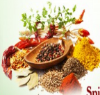
Spices மசாலா வகைகள்