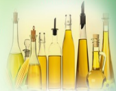
Oils மரசெக்கு எண்ணெய் வகைகள்