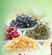
Pulses பருப்பு வகைகள்