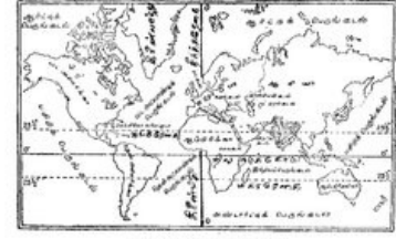
ஐரோப்பா கண்டம் - இடங்கள்

இதன் தோற்றம் அல்லது வடிவம் வட்டமாக உள்ளது; கரைகள் தாழ்ந்தவை; தட்டையானவை. இது அமைந்துள்ள மூன்று கண்டங்களின் தாழ்ந்த சமவெளிகளின் தொடர்ச்சிகளே அதன் கரைகள். ஆகவே, அதன் கரைகள் தாழ்ந்துள்ளன. கண்டம்