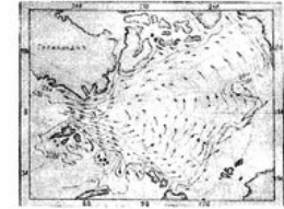
வெண் கடல் நீர்ப்பெயர்வு ஆழக் கெடுபடிகள் கட்டுதல் எதிர் திசை நகர உழைப்புகள். லாண்டன் 40

இதன் அடியிலுள்ள படிவுகள் நிலப்பகுதி யிலிருந்து ஆறுகளால் கொண்டு வரப்பட்டவை. இதில் பெரிய அமெரிக்க ஆறுகளும், சைபீரிய ஆறுகளும் கலக்கின்றன. இது நீர்க் கூட்டுக்களின் வாயிலாகப் பசிபிக்கடலோடும் அட்லாண்டிக் கடலோடும் சேர்கிறது.