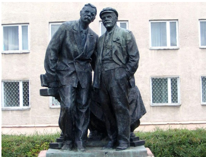
லெனின் கார்க்கி சிலை

சந்திக்கிறார். அவர்கள் நட்பு மீண்டும் மலர அச்சந்திப்பு உதவியது. அறிவு ஜீவிகளின் பங்களிப்பு பற்றி நேர்மறையாக லெனின் எடுத்துக்கொள்ள வேண்டும் என கார்க்கி விழைந்தார் கார்க்கி. தொழிலாளர் அறிவுஜீவிகள் ஒற்றுமை சரிதான். அறிவுஜீவிகள் அவசியம் என்பதை நான் மறுத்ததில்லை என லெனின் கார்க்கியிடம் தெரிவித்தார். ஆனால் அவர்கள் எங்களை விரோதியாக பார்க்கிறார்களே.. நாங்கள் இல்லையென்றால் அவர்களும் இல்லை என்பதை அவர்கள் புரிந்துகொள்ள வேண்டும் என்றார் லெனின்.