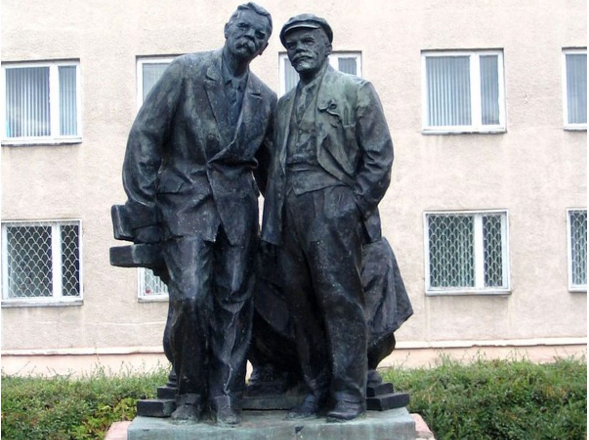
லெனின் கார்க்கி சிலை

லெனின் படுகொலை முயற்சி அறிந்து, அவர் குணமாகி வரும் வேளையில் கார்க்கி லெனினை சந்திக்கிறார். அவர்கள் நட்பு மீண்டும் மலர அச்சந்திப்பு உதவியது. அறிவு ஜீவிகளின் பங்களிப்பு பற்றி நேர்மறையாக லெனின் எடுத்துக்கொள்ள வேண்டும் என கார்க்கி விழைந்தார் கார்க்கி. தொழிலாளர் அறிவுஜீவிகள் ஒற்றுமை சரிதான். அறிவுஜீவிகள் அவசியம் என்பதை நான் மறுத்ததில்லை என லெனின் கார்க்கியிடம் தெரிவித்தார். ஆனால் அவர்கள் எங்களை விரோதியாக பார்க்கிறார்களே.. நாங்கள் இல்லையென்றால் அவர்களும் இல்லை என்பதை அவர்கள் புரிந்துகொள்ள வேண்டும் என்றார் லெனின்.